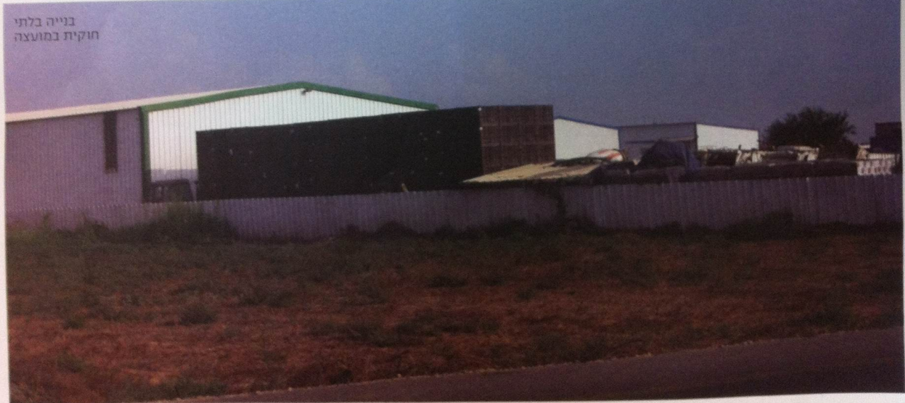
בנייה בלתי חוקית במועצה

הצילומים הוזמנו במסגרת פרויקט מקיף למחשוב ועדת תכנון ובנייה, שיאפשר לתושבים לרכוש מסמכים ולהגיש בקשות באמצעות אתר אינטרנט. כלי חדש בירי הועדה לתכנון ובנייה יסייע למאבק בתופעת הבנייה הבלתי חוקית ביישובים. לאחרונה הוזימה הועדה צילומי אוויר של כל השטחים באחריותה במיקור על היישובים. אלה יסייעו לעבודת השטח של הפקחים באיתור חריגות בנייה במטרה לעקור מהשורש תופעות הפוגעות במרקם החברתי והחקלאי ביישובים. לאחרונה החלה הועדה בפרויקט מקיף